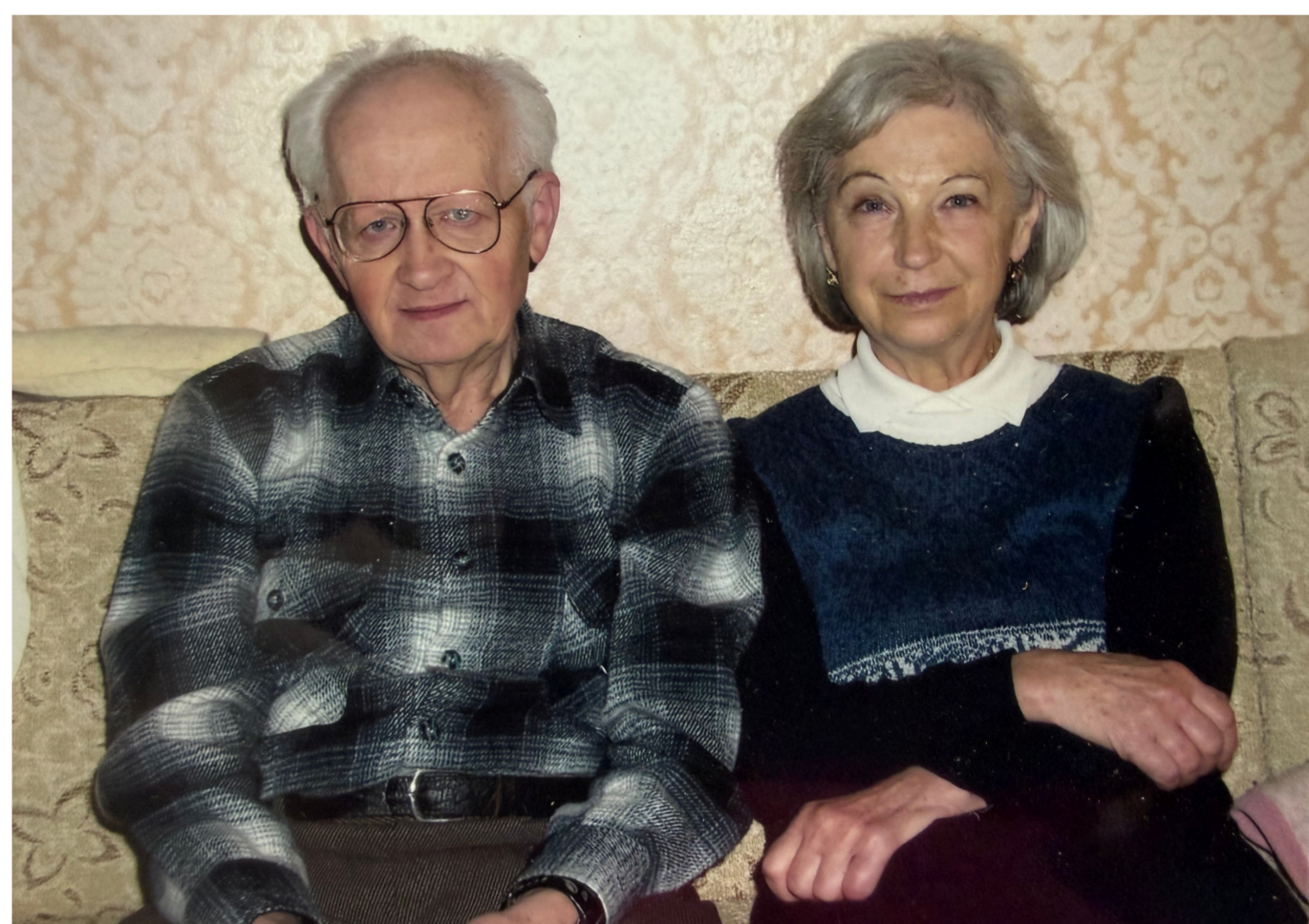
Tři měsíce před maminčinou smrtí oslavili rodiče zlatou svatbu.